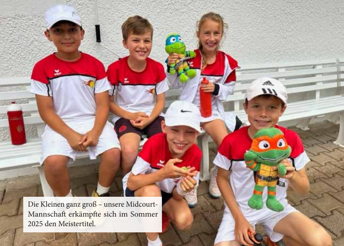
Die Kleinen ganz groß – unsere Midcourt-Mannschaft erkämpfte sich im Sommer 2025 den Meistertitel.