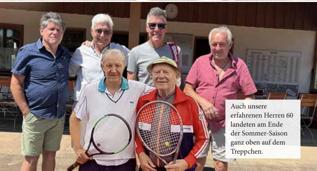
Auch unsere erfahrenen Herren 60 landeten am Ende der Sommer-Saison ganz oben auf dem Treppchen.