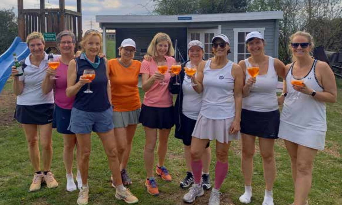
oben Super Stimmung beim Freundschaftsspiel gegen die Damen aus Pliening.