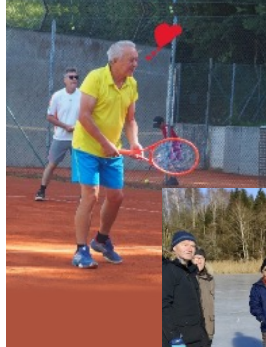
links Was ein neuer pinkfarbener Schläger alles bewirken kann!

Aber in den restlichen Spielen schafften wir jeweils ein souveränes Unentschieden. Stimmt nicht ganz.