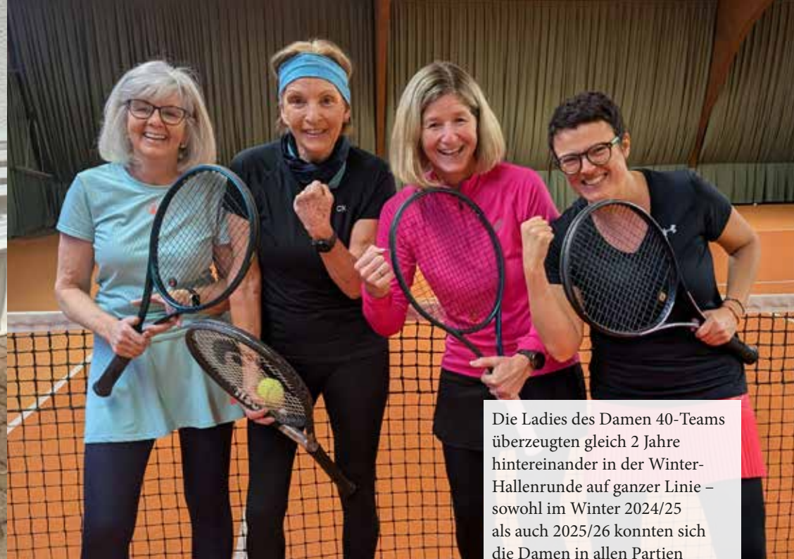
Die Ladies des Damen 40-Teams überzeugten gleich 2 Jahre hintereinander in der Winter-Hallenrunde auf ganzer Linie – sowohl im Winter 2024/25 als auch 2025/26 konnten sich die Damen in allen Partien mit einem unglaublichen 6:0-Sieg durchsetzen.