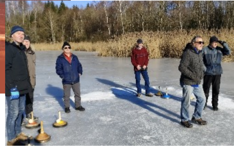
rechts Wintertraining – sicheres Bewegen auf glattem Bankett.

Im letzten Spiel gegen die TeG Mittlere Vils bekamen wir das entscheidende letzte Doppel verletzungsbedingt gutgeschrieben und somit war der Meistertitel nicht mehr zu verhindern. Wenn auch nur hauchdünn daneben.